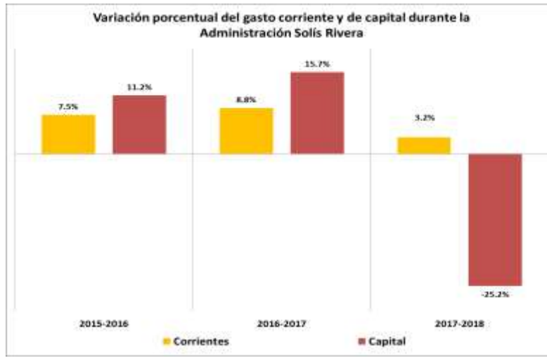
Gráfico N°. 2