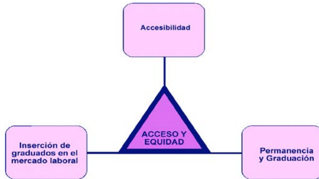
Diagrama 4: Eje de Acceso y equidad

El abordaje del eje “Acceso y equidad” se estructuró considerando los siguientes temas: