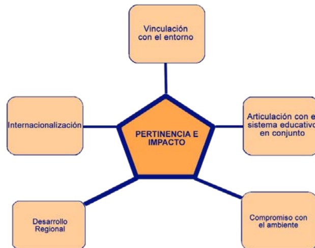
Diagrama 3: Eje de Pertinencia e impacto

El abordaje del eje “Pertinencia e impacto” se estructuró considerando los siguientes temas: