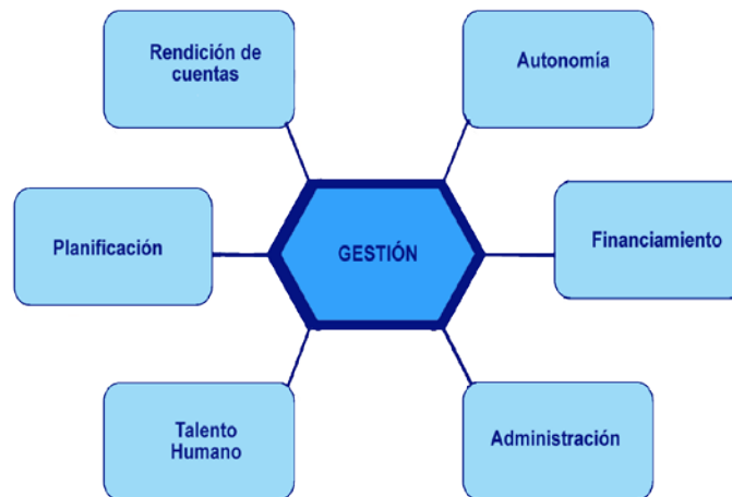
Diagrama 7: Eje de Gestión

El abordaje del eje “Gestión” se estructuró considerando los siguientes temas: