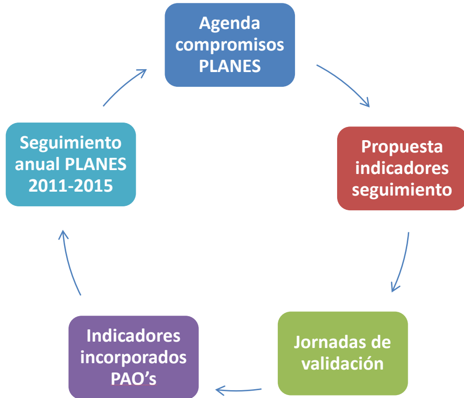
Diagrama 8: Proceso de Seguimiento del Planes