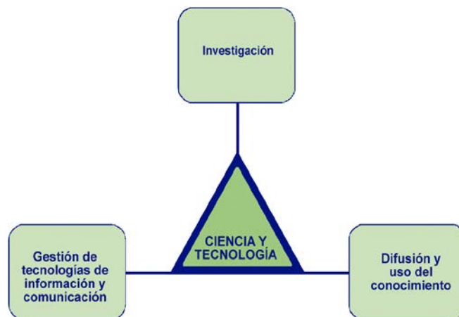
Diagrama 6: Eje de Ciencia y tecnología

El abordaje del eje “Ciencia y tecnología” se estructuró considerando los siguientes temas: